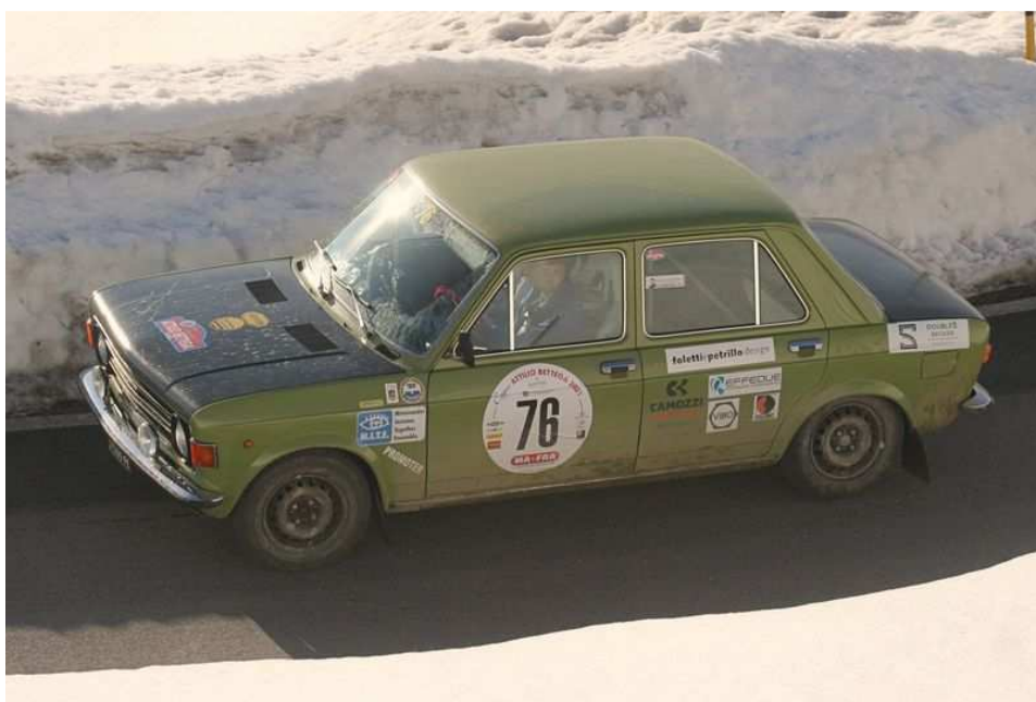
Il nostro equipaggio impegnato nella prova di media "Monte Grappa"

Una gara epica, insomma, che ha fatto respirare il profumo dei rally dei mitici anni '70 e '80, da mettere in calendario per il prossimo anno.