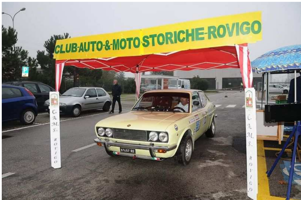
32° Giro del Polesine del 2019, alla partenza con il numero 1