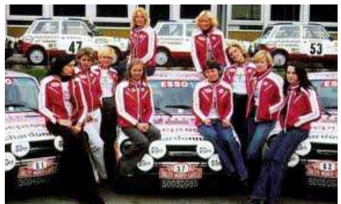
Il team di rally Aseptogyl con le A112 Abarth al Rally di Montecarlo del 1976