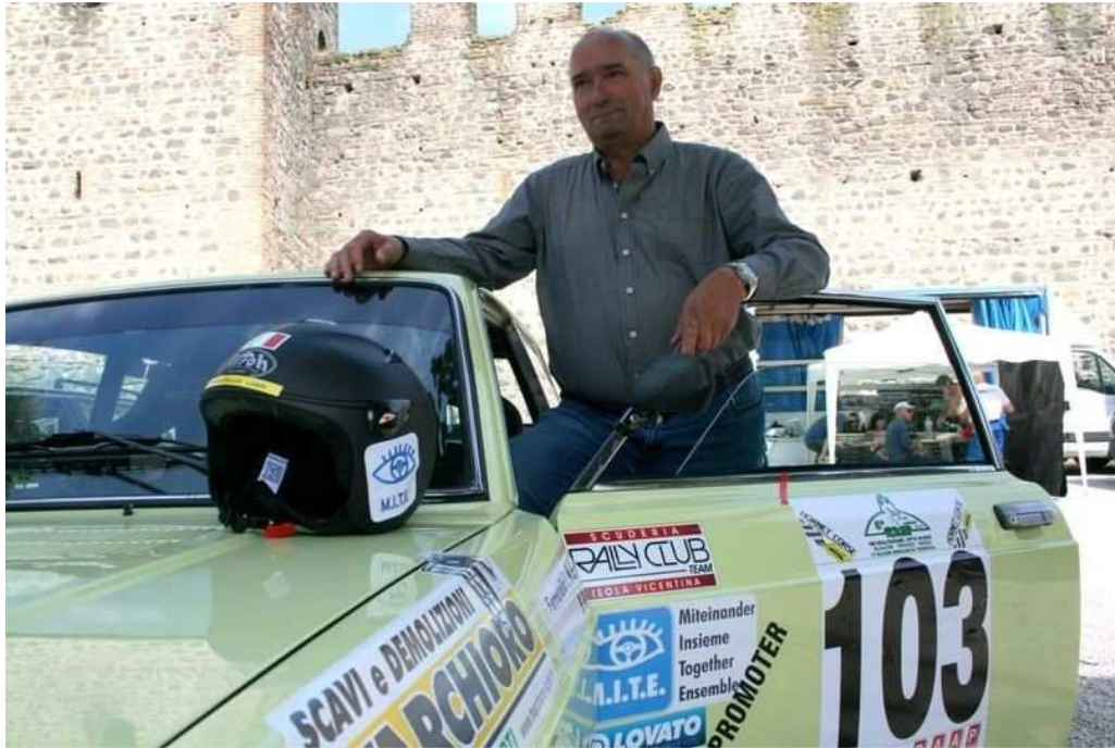
Regolarità slalom di Este del 2018